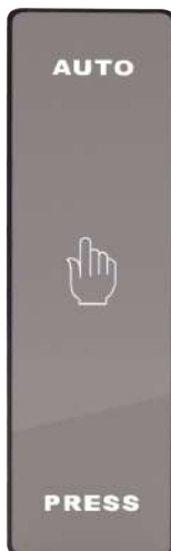
ด้านหน้า M202G