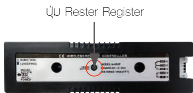
ปุ่ม Rester Register คอนโทรล Wireless สวิทช์ (ตัวรับสัญญาณ)